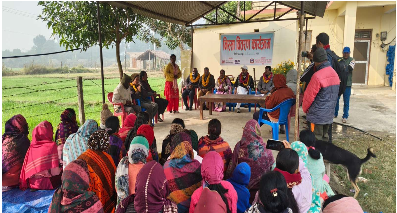
Figure 3 नरैनापुर गाउँपालिका वडा नं. ४ मा शुरुवात गरिएको निस्सा वितरण कार्यक्रम