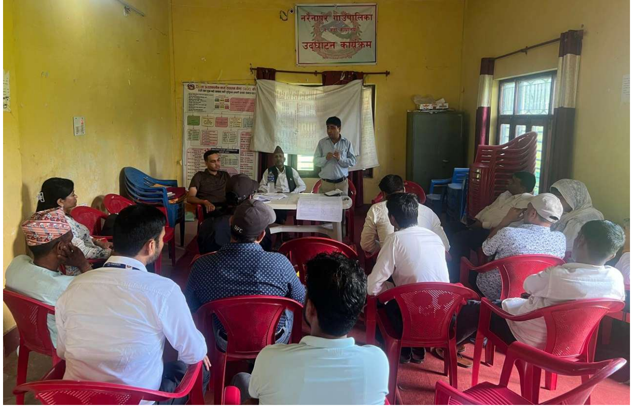
Figure 2 गाउँपालिकाले छनोट गरेका तथ्यांक संकलक र तथ्यांक प्रविष्टिकर्ताहरूका लागि १ दिने अभिमूखिकरण तालिम