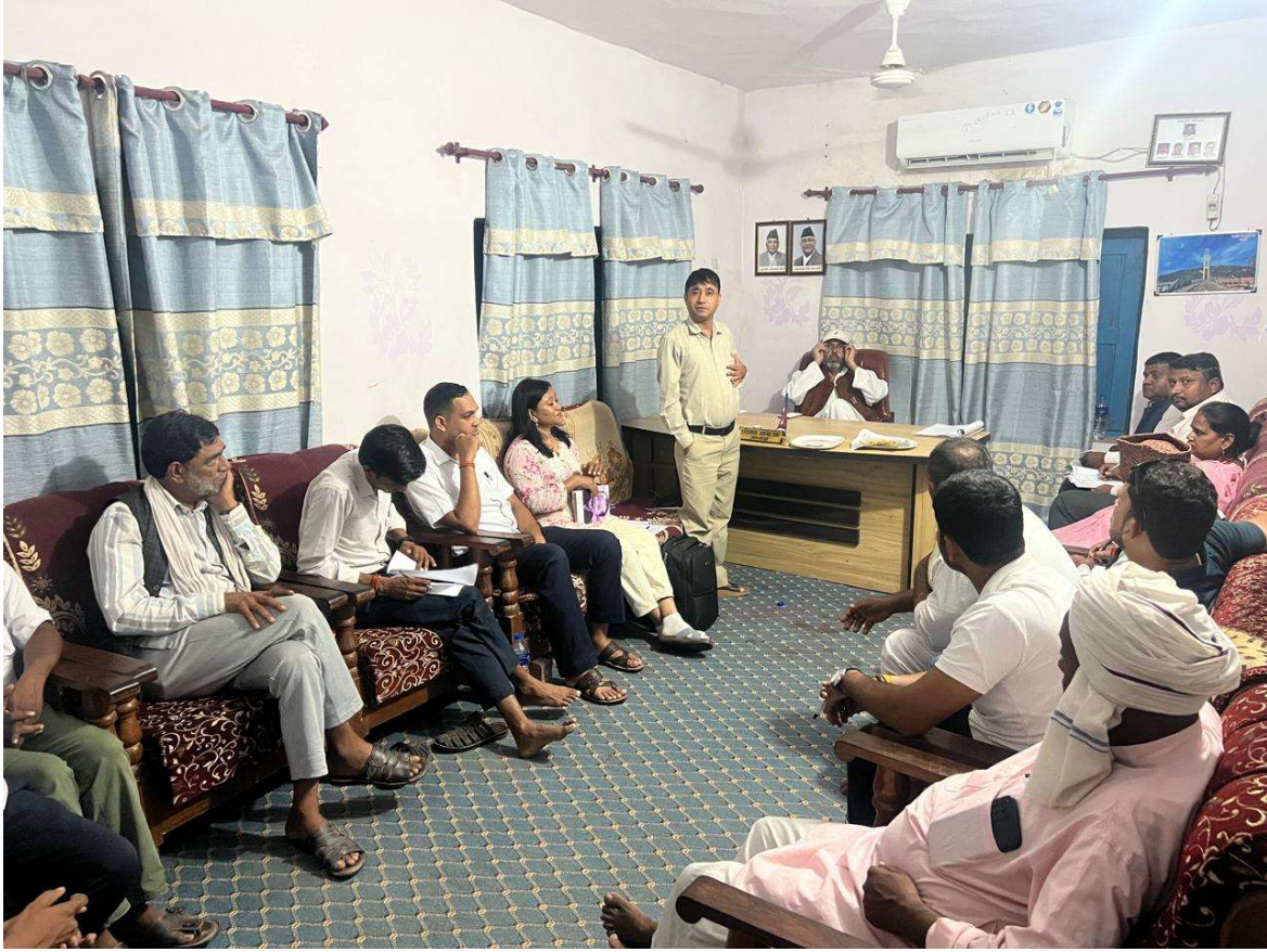
Figure 1 २०८२ भाद १७ मा नरैनापुर गाउँपालिका, जिल्ला भूमि आयोग बाँके र आत्मनिर्भर केन्द्रको संयुक्त पहिलो बैठक